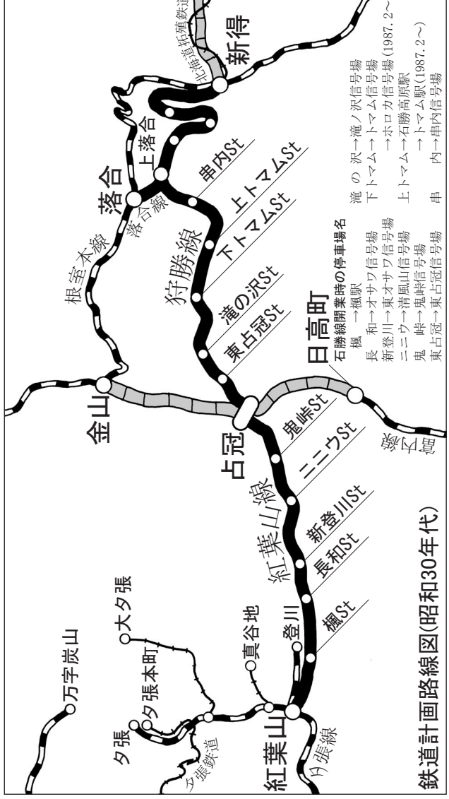
鉄道計画路線図(昭和30年代)

陸の孤島の中の孤島と言われたニニウ。今では鉄道に道路に電氣, 道央と道東を結ぶすべての幹線はニニウを通る。だが, それらを使ってニニウへ行くことはできない。最後に頼りになるのは, 今も昔も, 自然に随順な鬼峠である。